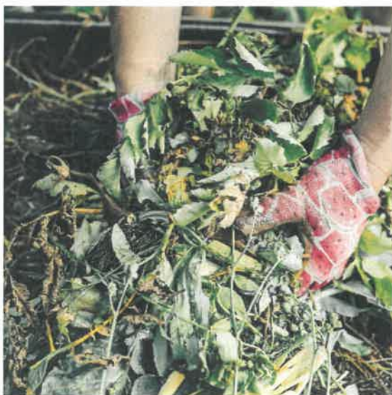
Abb. 1: Die richtige Schichtung ist ausschlaggebend.

Zur Vermeidung von Staunässe empfiehlt sich als unterste Schicht eine Lage gröberes, verholztes Material . Anschließend werden die verschiedenen Abfälle gut durchmischt oder separat in dünnen Schichten aufgetragen. Entscheidend für eine gute Kompostqualität ist eine möglichst vielfältige Mischung an Eingangsmaterialien . Besonders feuchtes Material wie Speisereste sollte immer direkt mit gehäckseltem Baum- und Strauchschnitt (= Strukturmaterial) vermengt werden. Auf diese Weise wird die benötigte Durchlüftung gewährleistet und zugleich Fäulnis verhindert. Um dauerhaft eine ausreichende Sauerstoffversorgung zu gewährleisten und zudem den Kompostierungsprozess zu beschleunigen, muss das Rottegut in regelmäßigen Abständen (circa alle 4 bis 6 Wochen) gewendet werden . Am Ende des Kompostierungsprozesses muss der fertige Kompost ausgesiebt werden, wobei das übrig gebliebene grobe Material neuerlich kompostiert und der gesiebte Kompost als Dünger oder Bodenhilfsstoff für Äcker, Beete oder Wiesenflächen eingesetzt werden kann.